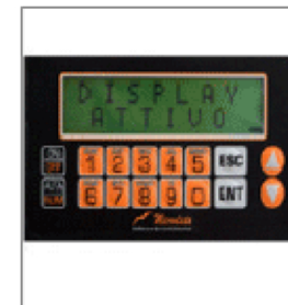
Tastierino sul retro