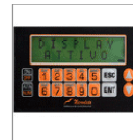
Tastierino sul retro