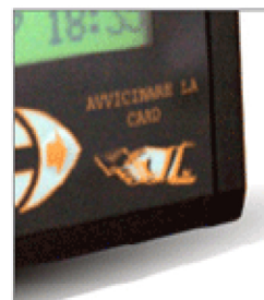
area di lettura card

Software, Servizi & Soluzioni C.da Colle delle Api, sn 86100 CAMPOBASSO Italia T: +39 0874 1865832