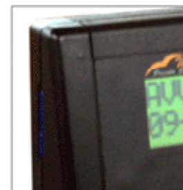
slot per SD card