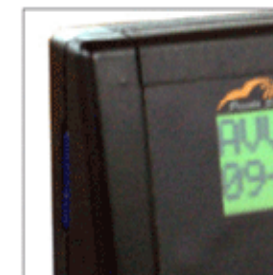
slot per SD card