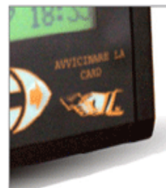
area di lettura card

Via S.Giovanni, 156/158 86100 Campobasso CB T: +39 0874 484641 F: +39 0874 618841 E: info@microdata-cb.com W: www.microdata-cb.com